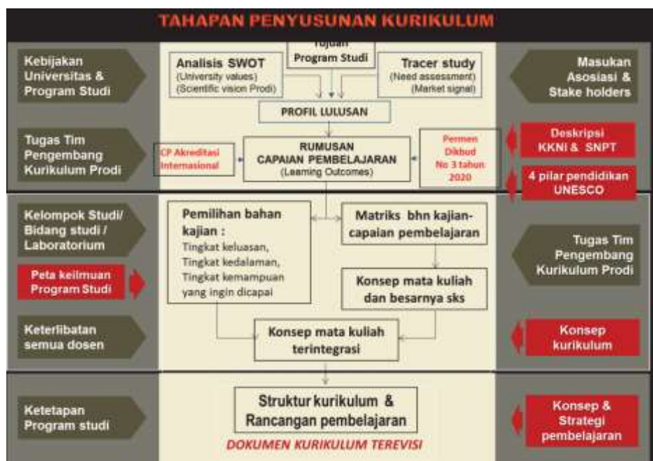
Gambar 4.2 Tahapan Proses dalam Penyusunan Kurikulum (Dimodifikasi dari Sumber Endrotomo, Tim Kurikulum DIKTI, 2016)

Kurikulum program studi di Untirta, hendaknya disusun berdasarkan visi dan misi Untirta guna menghasilkan lulusan yang berkompentensi tinggi sesuai dengan kebutuhan masyarakat dan perkembangan ilmu pengetahuan, teknologi, dan atau seni. Tahapan penyusunan kurikulum yang harus dilakukan Prodi diuraikan pada gambar berikut.